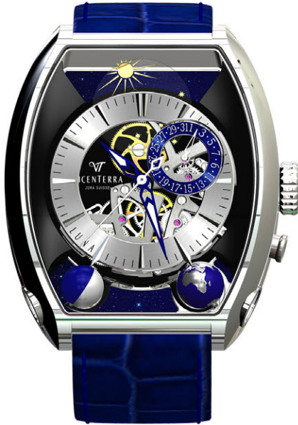
Tome 2 cadran ouvert

A l'occasion de BASELWORLD 2015, VICENTERRA donne le coup d'envoi d'une nouvelle souscription pour les garde-temps :