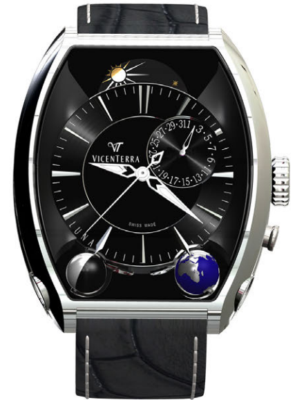
Tome 3 noir