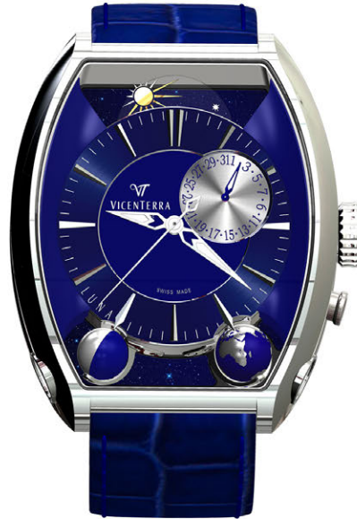
Tome 3 bleu