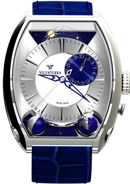
Tome 3 blanc